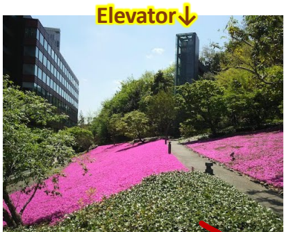
Famous for moss phlox (Shiba-zakura) in April